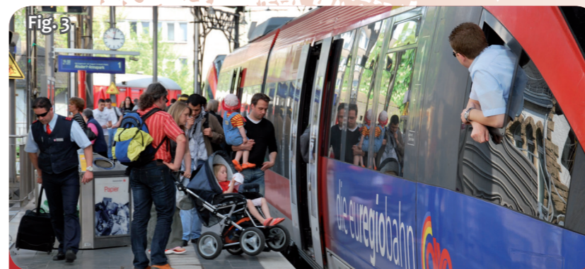
Fig. 3 L'Euregiobahn est une ligne de chemin de fer qui relie l'Allemagne et les Pays-Bas (mais malheureusement pas encore la Belgique).

Et toutes ces personnes améliorent la collaboration entre voisins! Les sociétés de trains et de bus ont créé un ticket Euregio (fig. 2), qui permet aux habitants de l'Euregio de se rendre à leur travail, de faire des courses ou une excursion plus facilement et moins cher. Les hôpitaux et les médecins essaient de travailler ensemble pour améliorer les soins de santé pour les citoyens de l'Euregio. La police et les pompiers aident leurs collègues des autres villes de l'Euregio lorsqu'ils en ont besoin. Et la protection de l'environnement est également une mission que les partenaires de l'Euregio se partagent. Pour que la collaboration fonctionne le mieux possible, l'Euregio reçoit de l'aide, sous forme d'argent, de l'Union européenne.