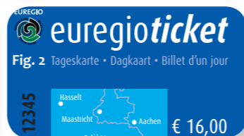
Fig. 2 Tageskarte • Dagkaart • Billet d'un jour

Dessine un drapeau pour l'Euregio Meuse-Rhin.