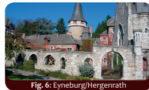
Fig. 6: Eyneburg/Hergenrath

La plupart des châteaux forts organisent des visites guidées. La plupart des châteaux (les châteaux de Satzvey et de Hoensbroek, par exemple) montrent comment on vivait, mangeait, chantait et se battait au Moyen Âge ( burgsatzvey.de ; kasteelhoensbroek.nl ).