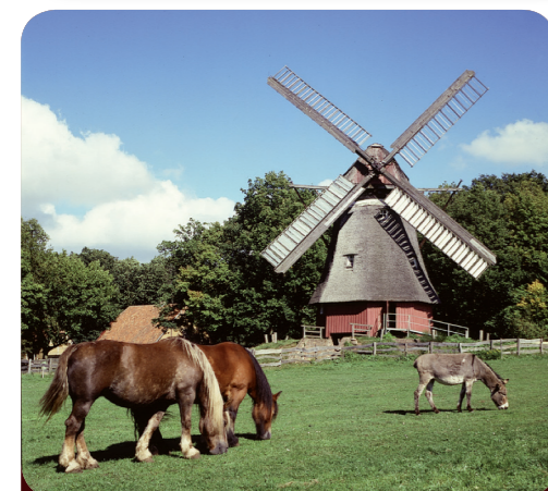
Afb. 1 - Leven in een dorp: overal in het openluchtmuseum zie je dieren.

2 Bedenk een museum voor scholieren over 100 jaar: wat moet er in dat museum staan, zodat jullie “opvolgers” een goed beeld krijgen van hoe jullie nu leven?