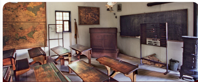
Afb. 3 - Oude dorpschool – ziet er toch (bijna) zo uit als nu!

In Kommern woon je met de hele klas zelfs voor een paar dagen 45 in het museum! Hier kun je oude kinderspelen ontdekken, brood bakken in een steenoven, vakwerkhuisen repareren, spinnen en