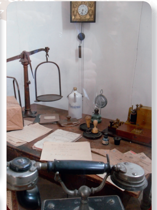
Afb. 6 - Een oud postkantoor: de telegraaf (rechts) en telefoon luidden het elektronische tijdperk in.

Houten vloer, weinig licht, geen verwarming: nauwelijks comfort in de slaapkamer.