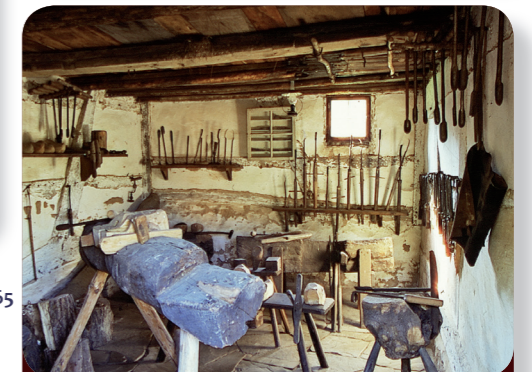
Afb. 7 - Alleen spierkracht en handwerk: in de werkplaats waren er nog geen elektrische machines en computers.