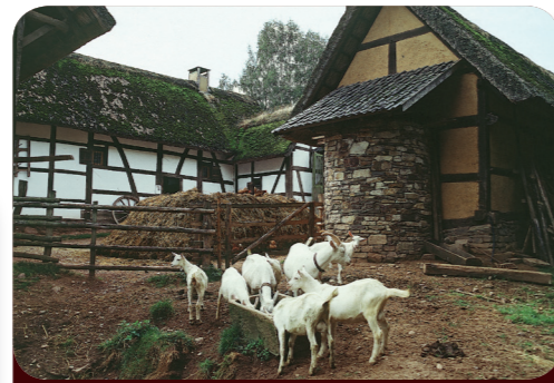
Afb. 2 - Een typische boerderij. Hier leefde vaak het hele gezin samen met de dieren.

In Bokrijk duik je bijvoorbeeld een paar uur lang in het leven van jullie leeftijdsgenoten die in 1911, dus ruim 100 jaar geleden, in een