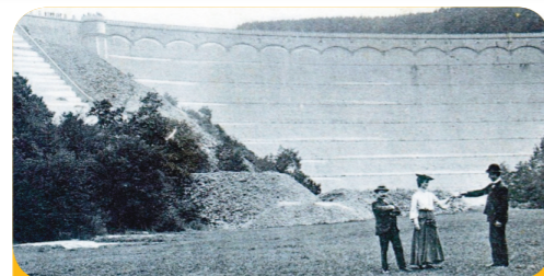
Abb. 2: Alte Postkarte der Urftstaumauer, erbaut 1904, eine der ersten Talsperren unserer Region.

Talsperren werden zu den unterschiedlichsten Zwecken errichtet: Bewässerung, Hochwasserschutz, Brauch- oder Trinkwassergewinnung, Energieerzeugung oder Freizeitnutzung.