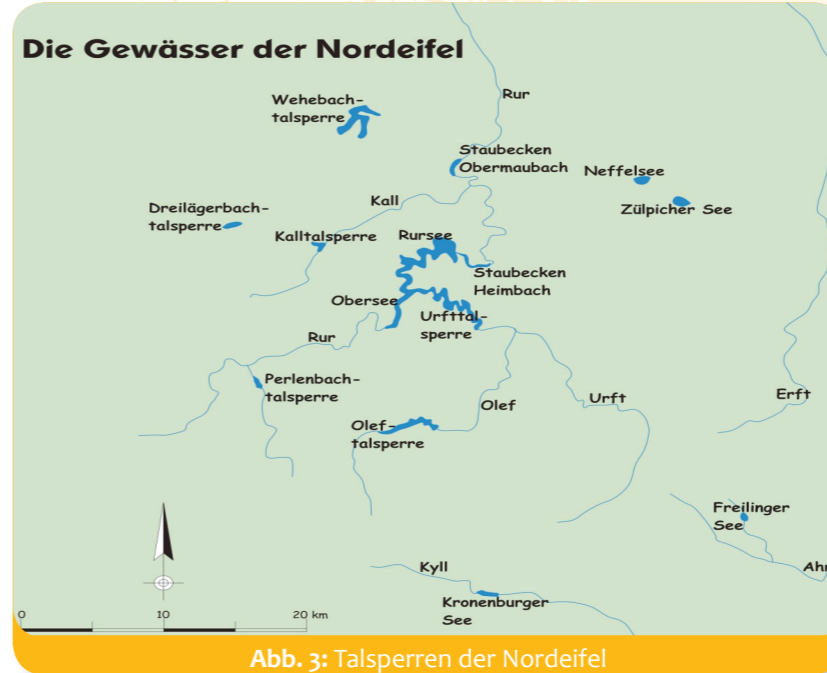
Abb. 3: Talsperren der Nordeifel