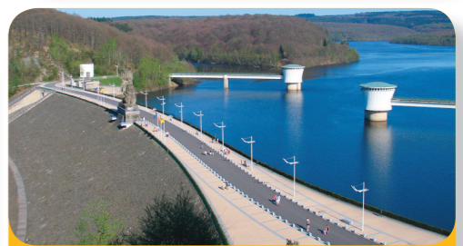
Abb. 4: Gileppe-Staudamm mit Betonmauer im Inneren