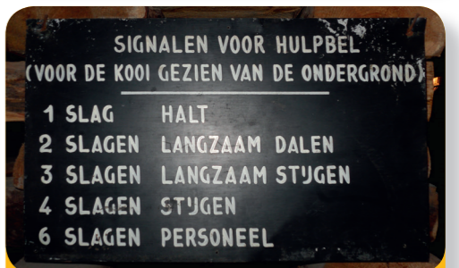
Afb. 8 - Onder de grond communiceerde men met een bel.