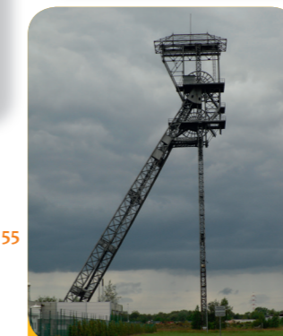
Afb. 7 - Houthalen-Helchteren