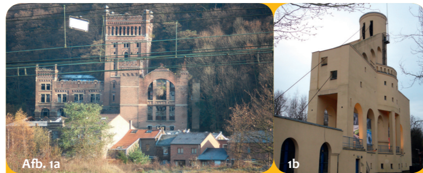
De kolenmijn van Cheratte met haar "Malakoff-toren" ziet eruit als een oude burcht. Schacht Nulland in Kerkrade oogt veel moderner.

Daarom werden de mijnwerkers goed betaald.