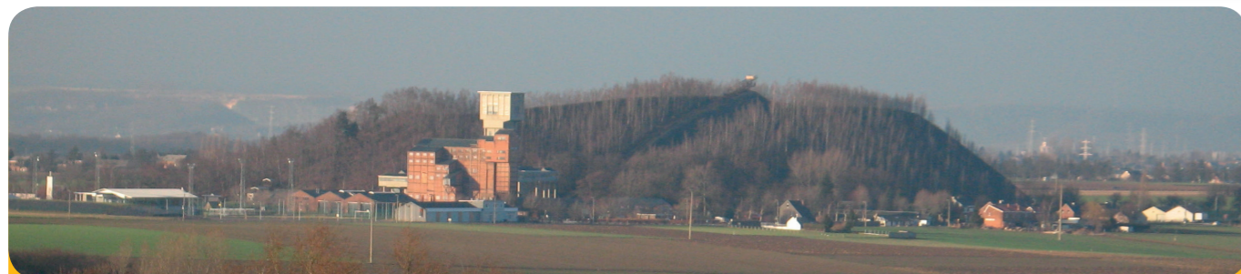
Afb. 4 - De bezoekersmijn van de kolenmijn Blegny met haar steenberg.

Waar steenbergen zijn, waren vroeger ook mijnen . In deze mijnen werkten mijnwerkers ("kompels"). Iedere dag daalden ze af in de groeven om de kolenbrokken met speciaal gereedschap en boormachines uit het gesteente te halen. Sommige groeven waren meer dan 1 000 meter diep. Het was daar beneden ontzettend heet en het werk was heel zwaar en gevaarlijk.