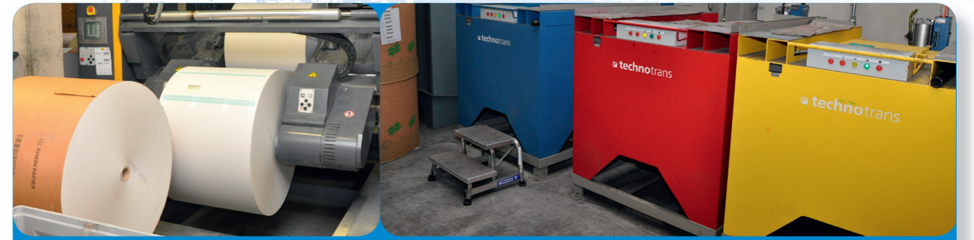
Fig. 4a-b: Des rouleaux de papier et des cartouches d'encre de la taille d'un homme !

MITTEL UND WEGE MOYENS ET MANIÈRES MIDDELEN EN WEGEN