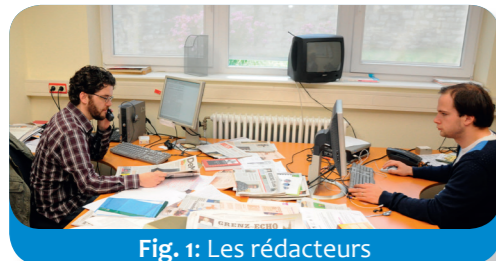
Fig. 1: Les rédacteurs

Suivons le parcours d'une nouvelle du Grenz-Echo, le journal quotidien de la Communauté germanophone de Belgique. Cela se passe de la même façon pour les autres journaux locaux.