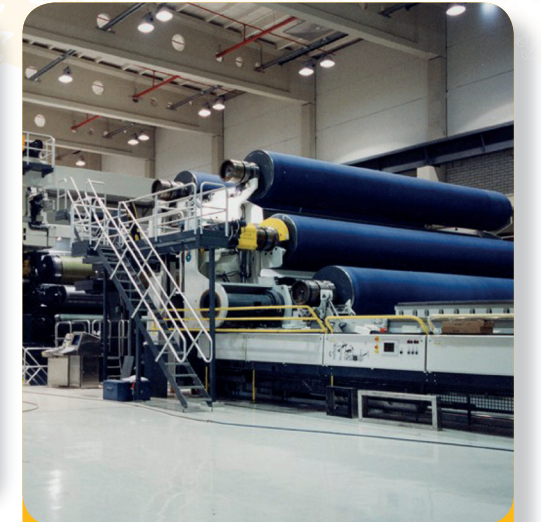
Fig. 5: Les machines que l'on trouve dans les papeteries modernes.

ENERGIE UND TECHNIK ENERGIE ET TECHNIQUE ENERGIE EN TECHNIEK